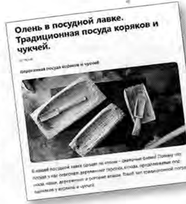
Какими были дома, мебель, посуда и одежда коряков, чукчей, алеутов, ительменов, зэнов, пользователи интернета теперь узнают на канале библиотеки в «Яндекс.Дзен»

Для очных пользователей проект тоже полезен. После просмотра интересной онлайн-истории многим хочется увидеть экспонаты своими глазами, потрогать их, поделиться впечатлениями с единомышленниками. И мы предоставляем посетителям эту возможность, ведь главная наша цель – разделить с другими восхищение достижениями удивительной и древней северной цивилизации.